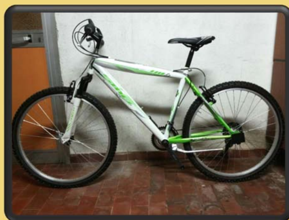
MTB SMP X-SCALE