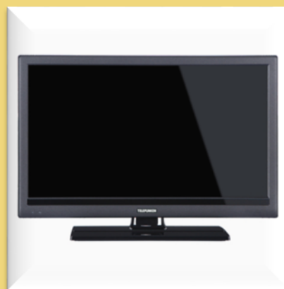
Tv led 16/9 Telefunken 20"