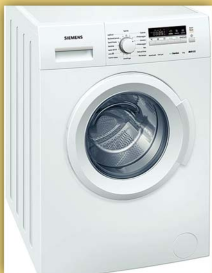
Lavatrice SIEMENS Ecogenius IQ100