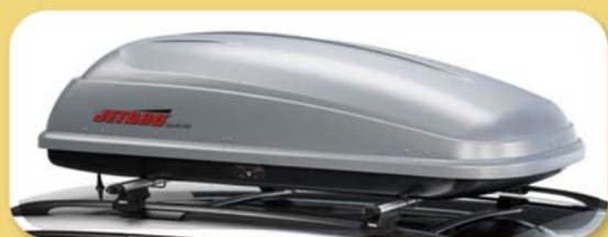
Box da tetto auto "Thule Apollo 200"