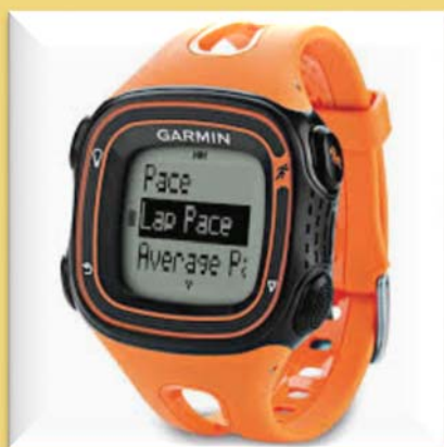
Garmin Forerunner 10 Orange